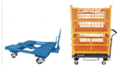
▲ハイキャスタ台車