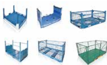
▲折畳式鉄製パレット

E-P JAPANでは荷物の搬送に不可欠な、折畳式鉄製パレット、ハイキャスタ台車も取り揃えております。